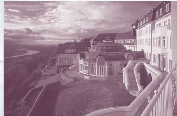
Grandhotel Petersberg, Königswinter